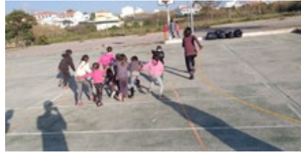
petit jeu avec les enfants