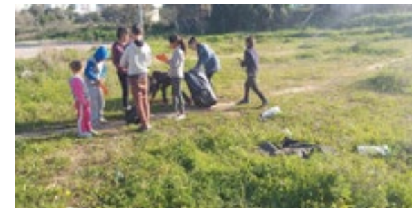
Tout le monde au nettoyage