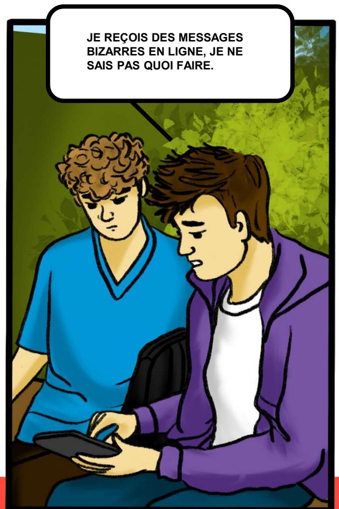
Illustration by Isasilva.com

be — be — be — be — be — be — be — be — be — be — be — be — aware aware aware aware aware aware aware aware aware aware aware aware